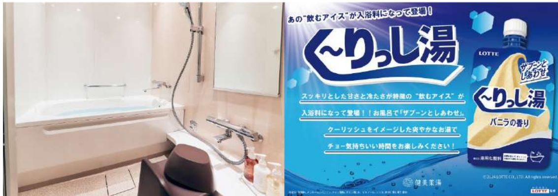
浴室と「く〜りっし湯」(イメージ)

独立したバスルームでお風呂時間もごゆっくりお過ごしいただけます。クーリッシュの入浴料「く〜りっし湯」をアメニティとしてご用意しております。