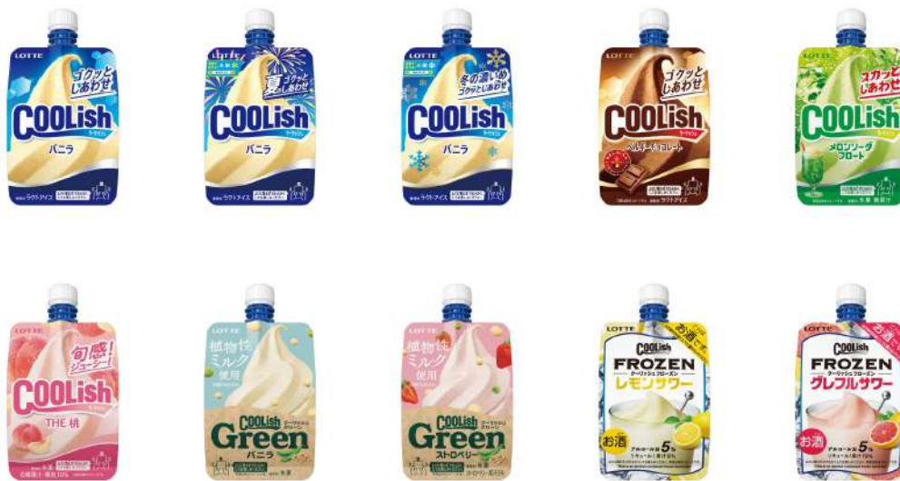
お部屋で楽しめるクーリッシュ10種（イメージ）

客室にある「クーリッシュ専用冷凍庫」でいつでもお好きなタイミングで、種類の違う10個のクーリッシュ（ラインナップは下記に記載）をお楽しみいただけます。