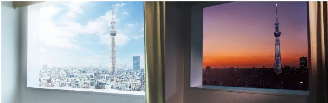
お部屋からの眺め（イメージ）

東京スカイツリー®の眺望を楽しめる高層階のロケーション。時間によって移り変わる景色は絶景の一言。窓際のソファに座ってクーリッシュタイム。優雅な時間をごゆっくりお過ごしいただけます。