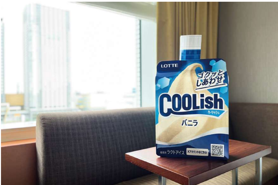
フォトプロップス（イメージ）

お部屋にあるクーリッシュの巨大フォトプロップスでクールな映え撮影会をお楽しみいただけます。