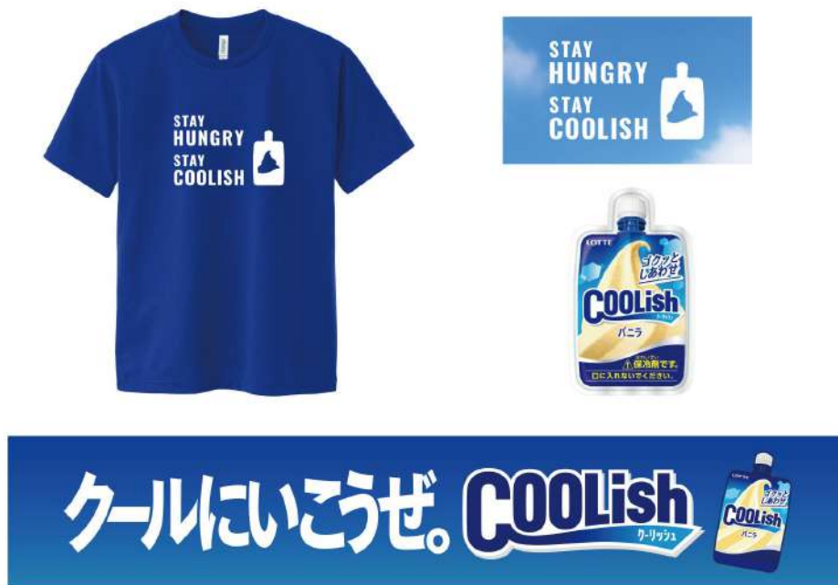
ご宿泊者限定特典(イメージ)

「STAY HUNGRY, STAY COOLISH Tシャツ」「STAY HUNGRY, STAY COOLISHオリジナルステッカー」「クーリッシュオリジナル保冷剤」「クールにいこうぜ。マフラータオル」(全て非売品)をご宿泊者限定特典としてお部屋にご用意しております。