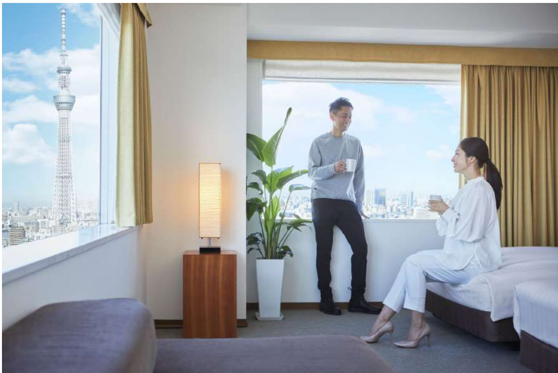
ロッテシティホテル錦糸町 (イメージ)