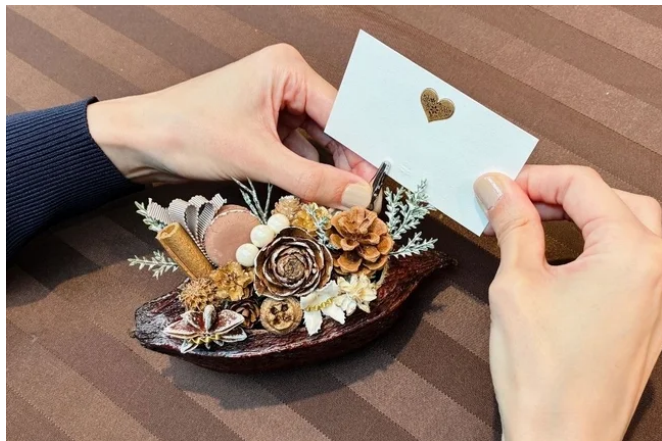
カカオポッドクラフト作りのイメージ