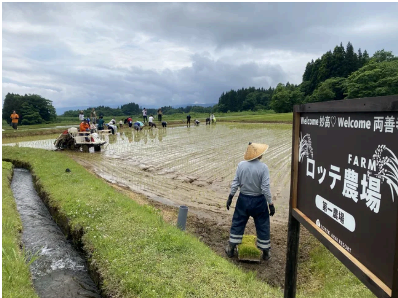
ロッテアライリゾート「星空米 田植え体験」の様子（2024年の様子）

さらに本イベントでは、“食の体験”を“旅”へとつなげる取り組みとして、ロッテグループの「ロッテアライリゾート」との連動施策を実施いたします。イベントで使用するロッテアライリゾートオリジナルブランドのコシヒカリ「星空米」は、新潟県妙高市両善寺地区で育てられた希少な「矢代米」を、昔ながらの“はさ掛け製法”で丁寧に仕上げた特別なお米です。妙高市の自然の恵みを受けた一粒一粒が、おにぎりのおいしさをより一層引き立てます。