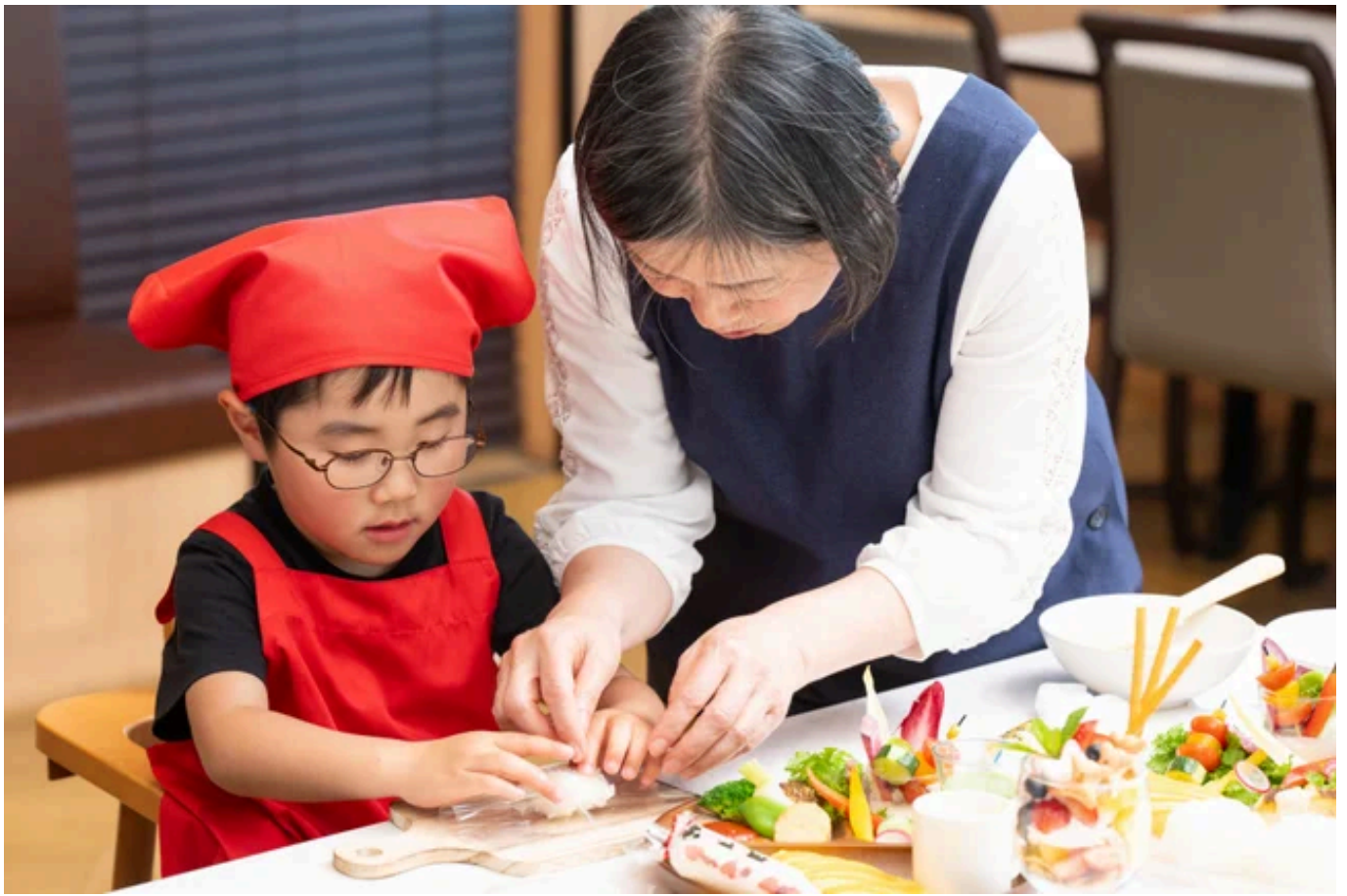
自分の手でおにぎりをつくり、お米のおいしさを実感（イメージ）