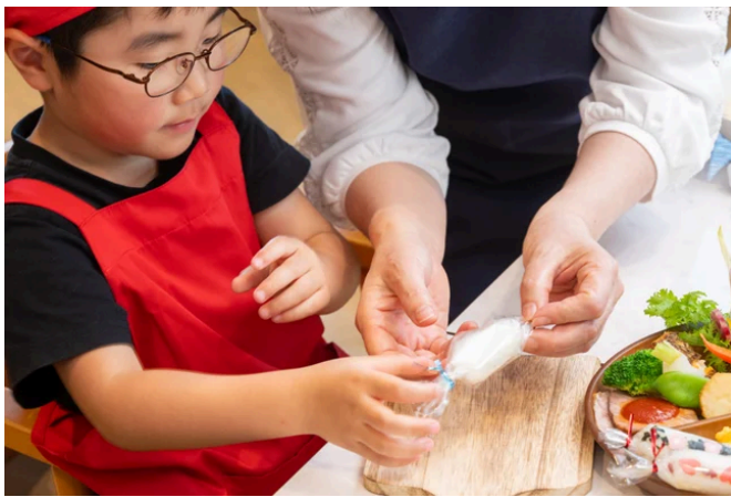
スティックおにぎりづくりにチャレンジ！（イメージ）