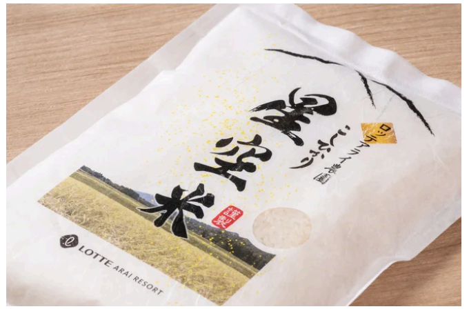
イベントのおにぎりには新潟県妙高市の「星空米」を 使用