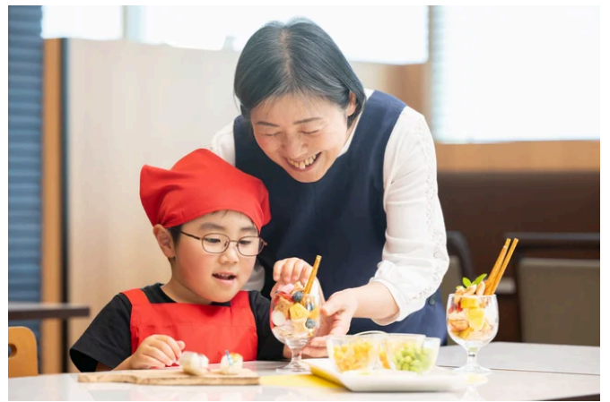
ミニパフェづくり体験も（イメージ）

本イベントでは、お子さまでもにぎりやすいスティック型のおにぎりづくりにチャレンジいただけます。好きな具材を自由に組み合わせながら、手を動かす楽しさと、おにぎりが形になるよろこびをご体感ください。ご家族でひとつの時間を共有することで、自然と会話が生まれ、心あたたまるとときをお過ごしいただけます。