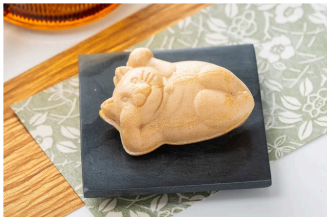
御菓子司 白樺の「たらふくもなか」

す。錦糸町の人気カフェ「すみだ珈琲」の「ドリップバッグコーヒー」とともにお楽しみいただけます。