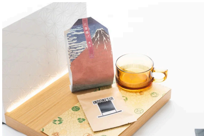
東あられ本舗の「北斎揚げ」(写真中央)