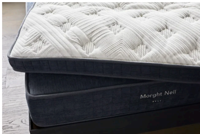
快適な睡眠をご提供する「Morght」の製品「NELL マットレス」(イメージ)

和の設えに包まれた空間に、心と身体を整えるウェルネスのエッセンスを加えました。寝具には、次世代の睡眠価値を提案する「Morght (モート)」の最上位マットレス「NELL Model H」と、創業460年の歴史を持つ「西川」の「羽毛寝具 (デュベ・ピロー)」を採用。「すべては最高の朝を迎えるために」という当ホテルのコンセプトのもと、上質な睡眠環境を整えております。お休み前には東京スカイツリー®を望むビューバスで、心ほどけるバスタイムをお過ごしいただけます。