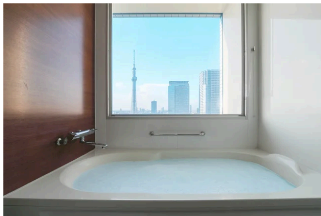
ご入浴はビューバスで絶景を望みながら (イメージ)