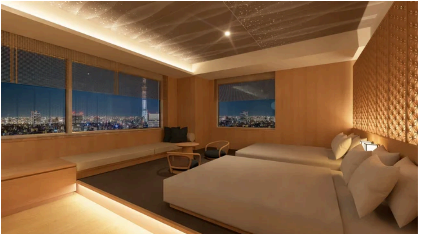
「タワーズジュニアスイートルーム」から眺める東京スカイツリー®（イメージ）

本客室のコンセプト「Tokyo Dual Landmark View & Relaxing Stay ～錦景の時～」の通り、東京スカイツリー®と東京タワーという二大ランドマークを同時に望む特別な眺望をご堪能いただけます。錦糸町を中心としたイーストトーキョーの街並みが、開放的な窓いっぱいに広がります。窓際のソファで寛ぎ、ダイニングテーブルで語らうたび、時間とともに移ろう景色が滞在をより豊かなものへと導きます。